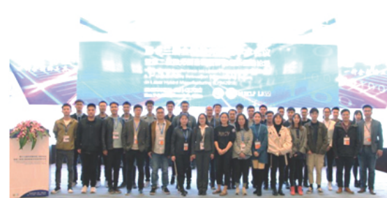
激光先进制造研究院部分参会人员