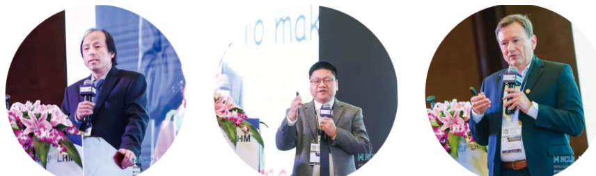
杨华勇 中国工程院院士 浙江大学机械工程学院院长

大会主题演讲环节，特邀国内外知名教授专家学者对当前激光研究的热点以及自己研究的成果进行了深入的分享。中国工程院院士、浙江大学机械工程学院院长杨华勇教授介绍了激光技术在生物器官3D打印中的应用；教育部长江学者讲座教授、美国内布拉斯加林肯大学陈永枫教授介绍了多功能结构的微尺度/纳米级3D打印研究进展；GE Additive全球大客户总监Burggraf Udo先生介绍了GE在各种航空零件金属增材制造方面的挑战和最新成果；浙江工业大学机械工程学院、激光先进制造研究院院长姚建华教授介绍了能场复合激光表面改性及增材再制造技术研究进展；德国Edgewave公司总裁杜可明博士介绍了超短脉冲激光在精密加工的应用与装置研发；北京工业大学激光工程研究院院长王璞教授介绍了高功率超快光纤激光器的核心器件、关键技术及产业应用；温州大学副校长薛伟教授介绍了超快激光技术在制备表面微结构和功能化微孔方面的研究。